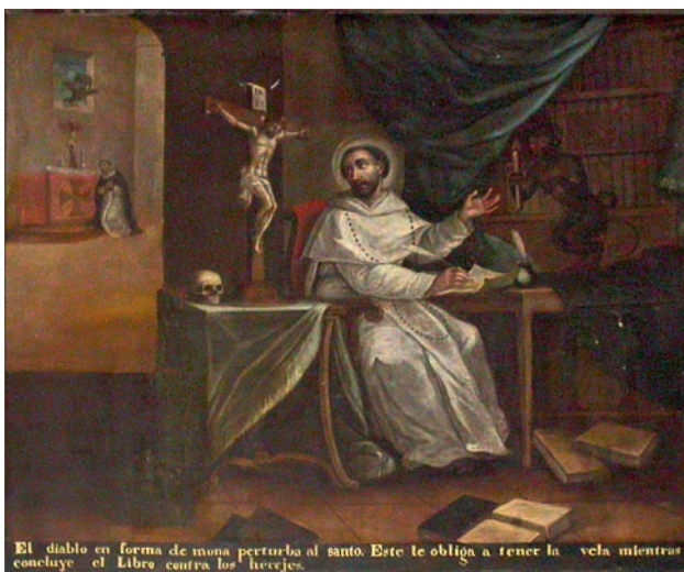
Escena de la Vida de Santo Domingo Iglesia de Santo Domingo

A dos años de la gestión del encargo, los cuadros de la Serie de la Vida de Santo Domingo se encontraban adornando los claustros del convento, según relatan los archivos de la orden recalcando que