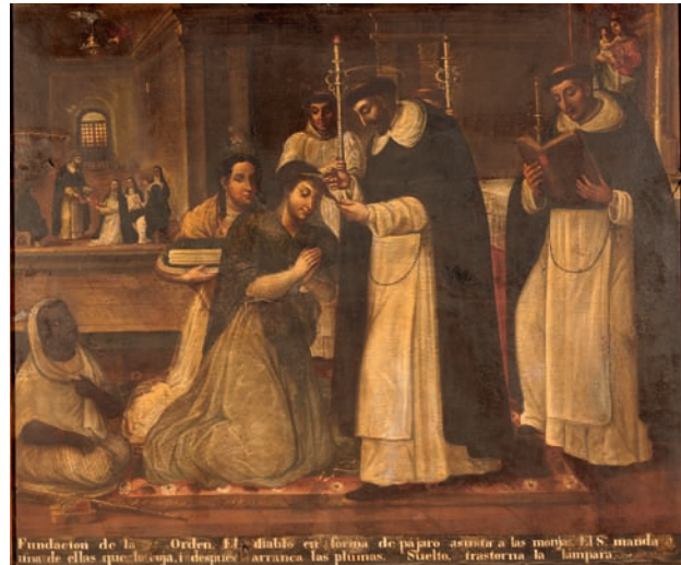
Fundación de la Orden Sacristía Iglesia Recoleta Dominica

Posteriormente, asume el cargo de Vicario General el Fr. Francisco Álvarez, natural de Mendoza, el 18 de agosto de 1837, quien además retoma las negociaciones del encargo. Sin embargo sus aspiraciones le llevaron a evaluar la posibilidad de realizar el encargo a Europa a artistas italianos, pero los costos resultaban muy altos para el convento. 3 Por lo tanto, se debió buscar un camino más idóneo y es así que durante el mismo año de 1837 ya se le otorgan las gratificaciones a Antonio Palacios por concepto de compras de géneros para los lienzos y otros elementos, como se señala en los libros contables de la Orden