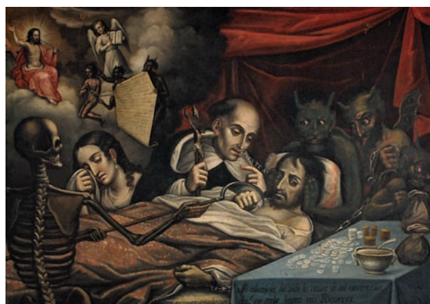
La buena muerte y La mala muerte, Iglesia de San Vicente Ferrer.