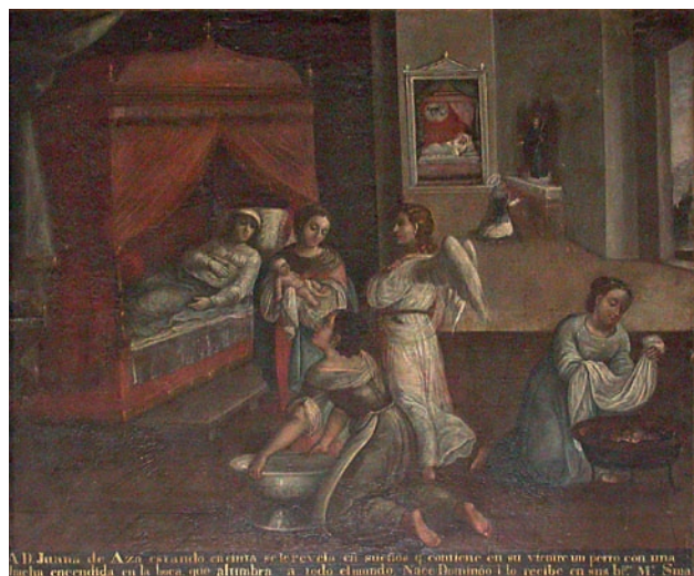
Nacimiento de Santo Domingo Iglesia de Santo Domingo