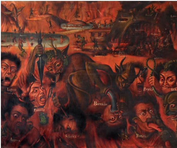
Los pecados Capiales Iglesia de San Vicente Ferrer